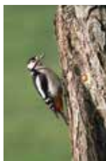
Le pic épeiche