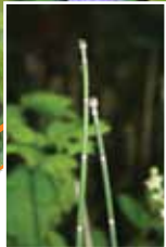
La prêler d'hiver