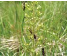
La listère à feuilles ovales