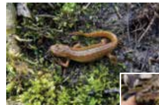
Le triton palmé