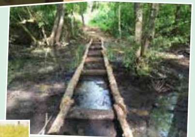
La passerelle en construction