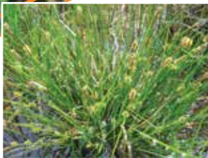
La laïche à fruits écaillés