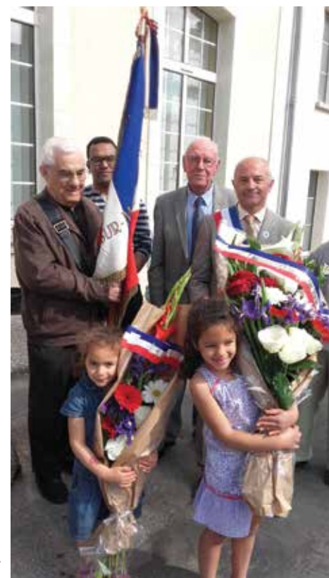
Cérémonie du 8 mai