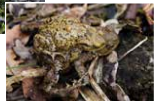
Le crapaud commun