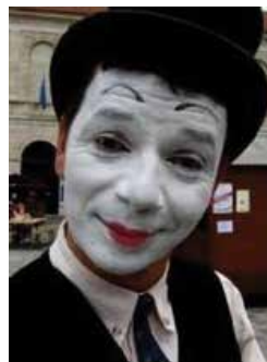
Compagnie des MIMES