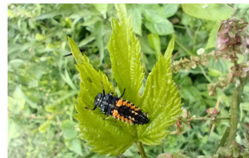
Larve de coccinelle